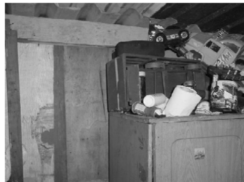
Figuras 2a e 2b - Detalhes do interior de casas localizadas próximas à fundição em Adrianópolis, PR, mostrando locais de acúmulo de poeira contaminada.