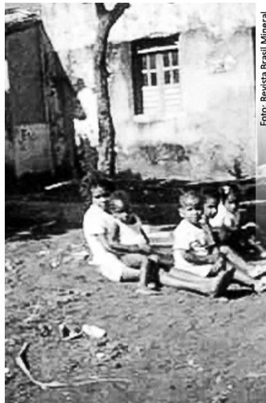
Figura 2 - Crianças expostas ao rejeito contaminado.

posição adequada para a escória, fizesse a instalação de poços de monitoramento para detecção de possíveis poluentes no lençol freático, e realizasse estudos que impedissem a propagação da contaminação e possibilitasse o encapsulamento da escória (ANJOS; SÁNCHEZ, 2001).