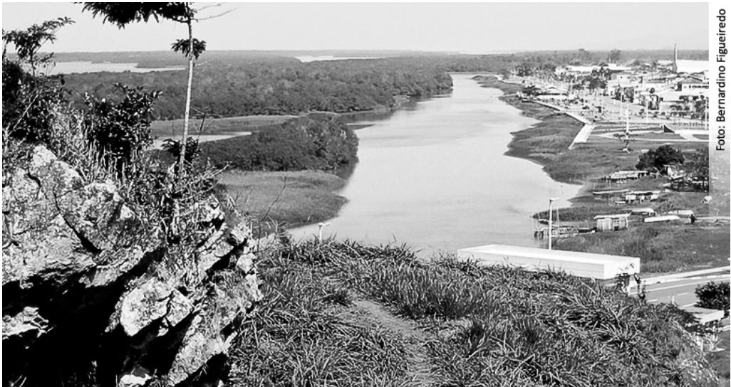
Figura 6 - Vale do rio Ribeira de Iguapé (SP e PR).

O vale do Ribeira já foi uma das maiores províncias metalogenéticas de chumbo do Brasil. Há na região um importante reservatório de água doce, além de boa parte da Mata Atlântica remanescente (Figura 6) (LOPES Jr. et al. , 2006). Ao longo do século XX, diversas minas de chumbo, zinco e prata foram exploradas no alto vale (CUNHA et al. , 2006).