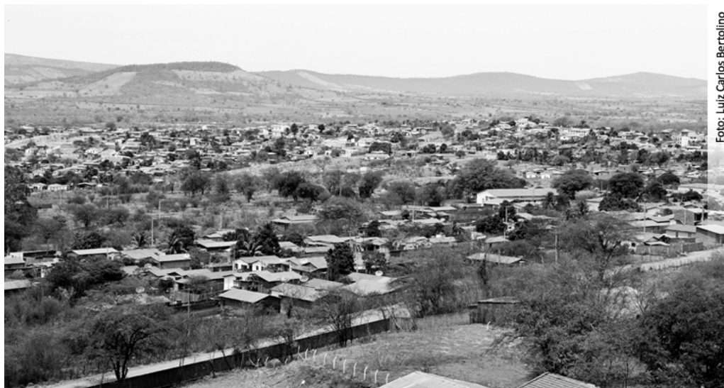
Figura 3 - Cidade de Boquira.

A exemplo do que ocorreu no município de Santo Amaro, no Recôncavo Baiano, os moradores do município de Boquira, localizado no sudoeste da Bahia, estiveram expostos à contaminação por chumbo durante décadas (Figura 3) (BARRERO, 2008).