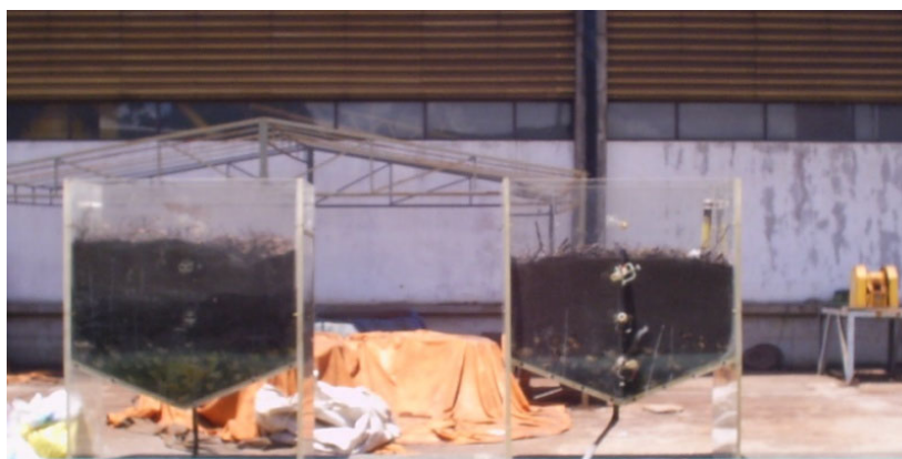
Figura 1: Lisímetros com solo contaminado de petróleo

tempo (entre meses e até anos). No primeiro dia foram analisados: germinação de sementes com Lactuca sativa , mortalidade das minhocas com Eisenia fetida , atividade de desidrogenase (AD), pH, hidrocarbonetos totais de petróleo (TPH), o conteúdo de população microbiana (Microorganismos hidrocarbonoclasticos, Microorganismos Heterotróficos totais), Densidade Aparente, Densidade de Partículas (DP), porosidade, Capacidade de Retenção de Líquidos (CRL). Mensalmente foram analisados: TPH, o teor de população microbiana, pH, AD, germinação de sementes com Lactuca sativa . Trimestralmente eram vistos o nitrogênio (N), fósforo (P), Densidade Aparente, DP, porosidade, CRL, mortalidade das minhocas com Eisenia fetida .