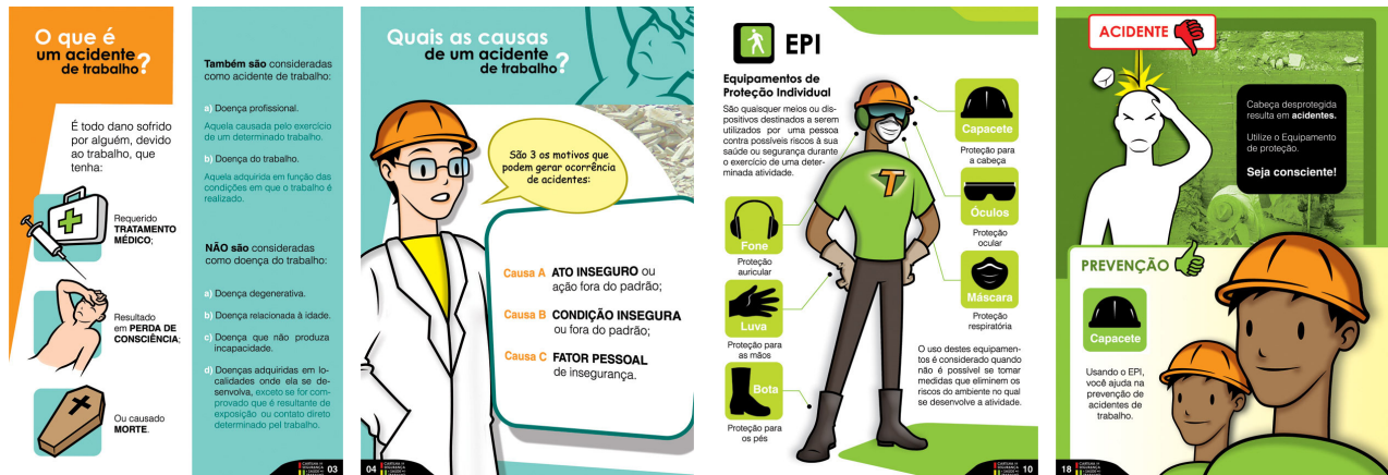
Figura 5. Algumas páginas ilustradas da cartilha.

O verde e o laranja foram escolhidos para o fundo pelos seus significados, que são os mais importantes a serem transmitidos em primeira instância, ou seja, segurança e prosperidade. A sombra atrás do boneco branco do lado esquerdo constitui a proteção a ser aderida ao trabalhador, em seguida se vê o mesmo proletário só que equipado e seguro. É uma seqüência que representa o comportamento apropriado a ser seguido para a prevenção de acidentes.