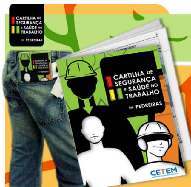
Figura 4. Imagem do resultado final.

Posteriormente às considerações feitas e do conteúdo apostado, chegou-se à seguinte definição de design para a comunicação desejada: uma programação visual temerária e contemporânea, contudo simples e funcional. E, embora a cartilha seja de extrema seriedade, a roupagem jovial é a questão que marca a diferença desse material e, destarte, se espera atingir não só o operário jovem (que se trata de uma faceta do público-alvo preocupante, pois acha que não lhe acontecerão os acidentes, sendo imprudente no ambiente de trabalho), mas também, o operário mais experiente.