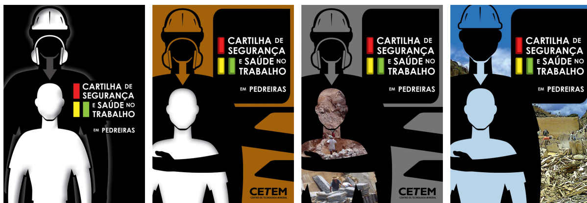
Figura 3. Algumas das variações do conceito da capa da cartilha.

Outro detalhe, que é importante ressaltar, foi o entendimento de como funcionam os APLs (Arranjos Produtivos Locais) através de vídeos, fotos e sites para saber como as empresas instaladas podem exercer o aprendizado coletivo e a troca de informações, vendo assim como a cartilha será aproveitada quando for aplicada.