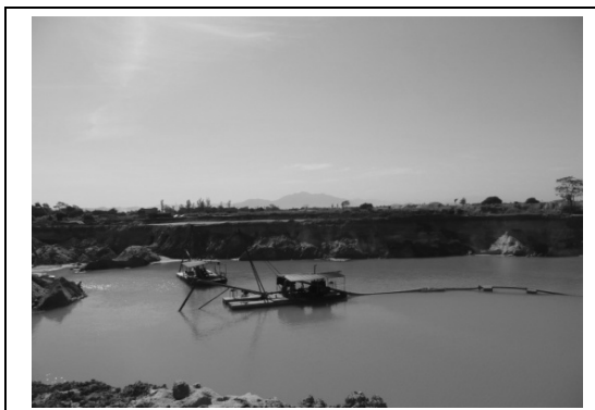
Foto 5 – Balsa extraindo a areia no areal Quindim-Seropédica/RJ, 26/05/2011.