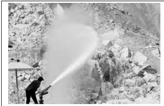
Foto 10 – Lavra de areia em cava seca com desmonte hidráulico.

Esse método de lavra apresenta vantagens quando comparado com os métodos de desmonte mecânico, tais como baixo investimento e elevada recuperação na lavra, no entanto apresenta como desvantagens a baixa seletividade do método de lavra empregado e a alta diluição da polpa nas bacias de acumulação (PISSATO, 2009).