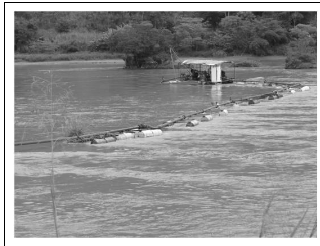
Foto 1 – Lavra no leito do Rio Paraíba do Sul –Amapará-Distrito de Sapucaia-RJ (Areal Amapará Ltda), 28/04/2011.