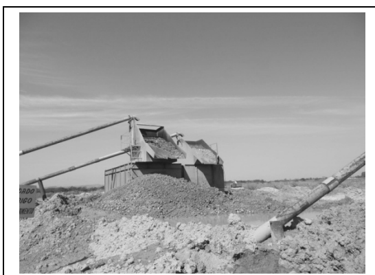
Foto 6 – Material retido na peneira da primeira lavagem da areia (Areal Quindim-Seropédica-RJ), 26/05/2011.