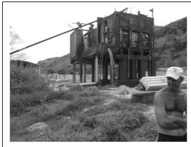
Foto 2 – Silos de recepção da polpa de areia extraída no leito do Rio Paraíba do Sul, Jamapar-Distrito de Sapucaia-RJ (Areal Jamapar Ltda), 28/04/2011.