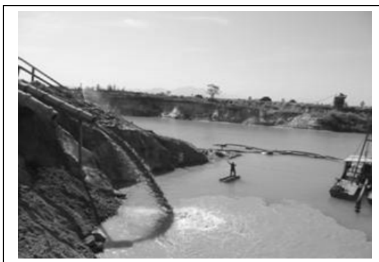
Foto 7 – A areia na forma de polpa passante na primeira peneira vai para um setor da cava (Areal Quindim, Seropédica-RJ), 26/05/2011.