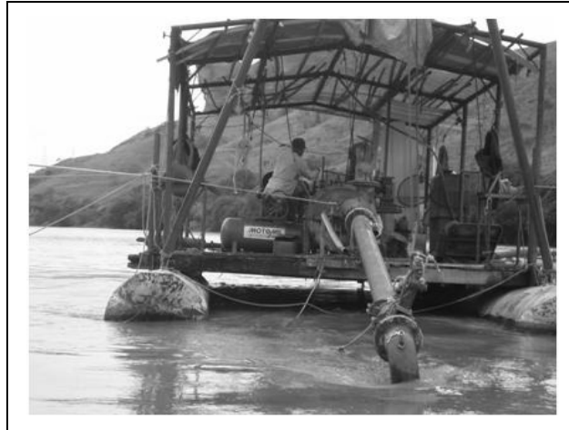
Foto 3 – Sucção da areia com bomba centrífuga no leito do Rio Paraíba do Sul, Jamapará-Distrito de Sapucaia-RJ (Areal Jamapará Ltda), 28/04/2011.