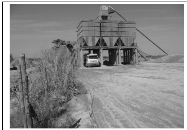
Foto 9 – Expedição do produto por carregamento direto nos caminhões fora de estrada, 26/05/2011.