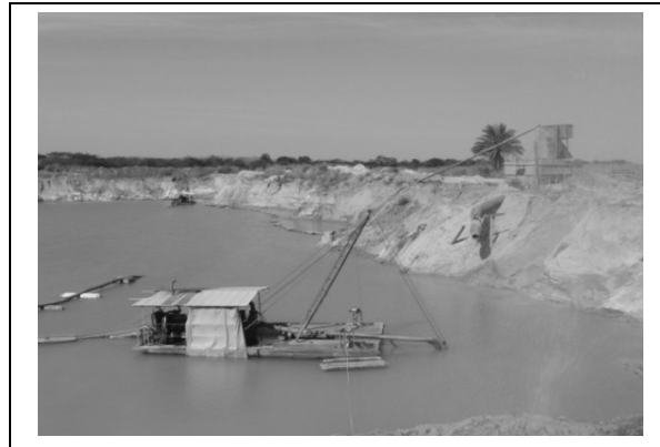
Foto 8 – Re-extração da areia (relavagem) na cava e novamente bombeada para as caixas (Areal Quindim), 26/05/2011.