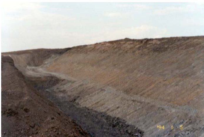
Figura 1: Frente de lavra típica de uma mineração de bentonita em Greybull, Estado de Wyoming-EUA (Luz et al. 2001a).

Na lavra são empregados trator e motor-scraper para fazer o decapeamento. O carregamento da bentonita é feito com pá carregadeira e o transporte dessa até a unidade de processamento é feito em caminhões fora de estrada. Na lavra são empregados trator e motor-scraper para fazer o decapeamento. O carregamento da bentonita é feito com pá carregadeira e o transporte dessa até a unidade de processamento é feito em caminhões fora de estrada. Em uma frente de lavra típica na região podem ser identificadas sete tipos de bentonita (verde, amarela etc). A lavra de cada tipo de bentonita depende muito do uso que se requer do produto a ser obtido (lama de perfuração, areia de fundição, pelletização de minérios de ferro etc.).